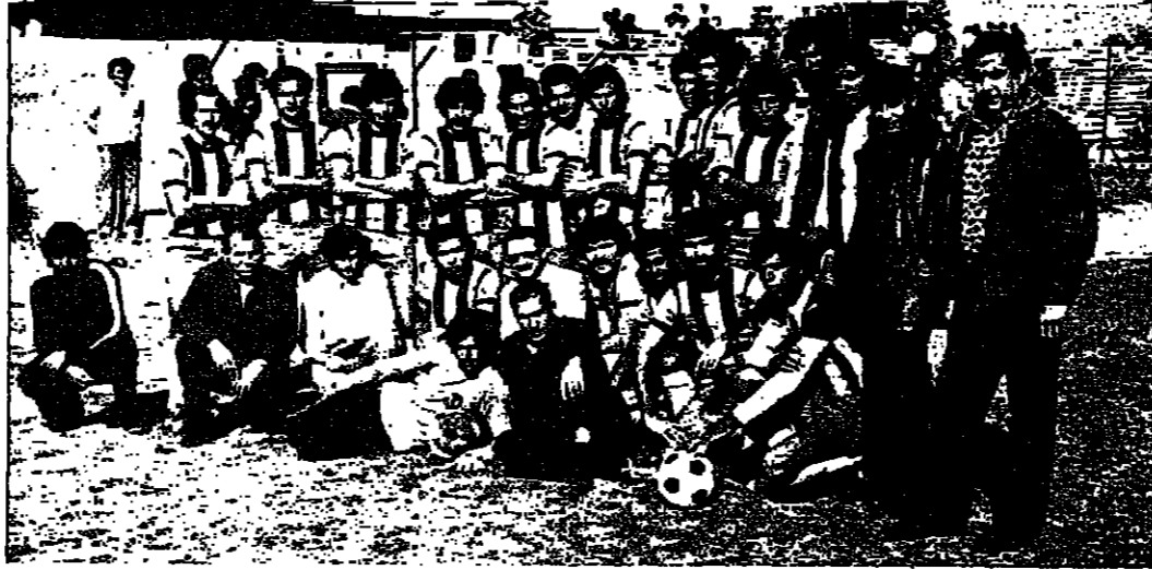
هيو عييل شباب اللد

فوز احمد مجد الكروم ، كفر سميع ، العمل الناصرة ، شفا عمرو ، عين ماهل ، كشافة حيفا ، باقة الغربية ، طمرأ وألد وتعامل ابو سنان ، الزرعة ، عرابية ، بيتار عين ماهل ، باقة الناصرة ، بئر ابو الجش ، معاوية وكفر قاسم ..